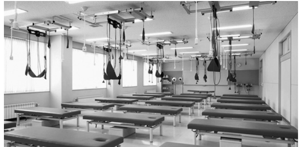
「理学療法学科・治療室」